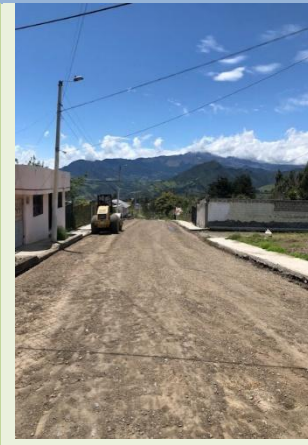
Calle Humberto Gómez