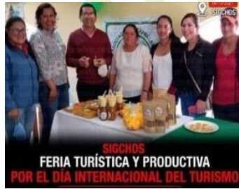
Feria Turística Productiva