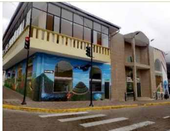
Inauguración oficina de turismo