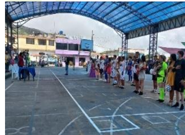
Campeonato de Ecuavoley