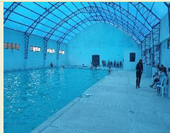
Apertura piscina municipal