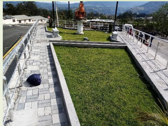
CONSTRUCCIÓN DE CUBIERTA DE PLAZA EN EL CENTRO DE CHUGCHILÁN, PARROQUIA CHUGCHILÁN, CANTÓN SIGCHOS (CÓDIGO: MCO-GADMSIG-005-2021)