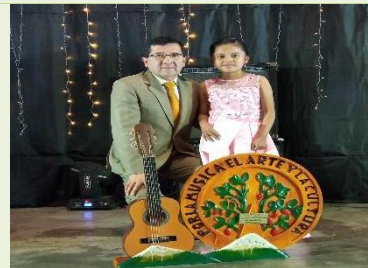
Festival del Tomate de Oro

Además, se realizaron cursos vacacionales de danza, pintura y fútbol con la finalidad de desarrollar las destrezas de los niños en los diferentes campos artísticos y deportivos.