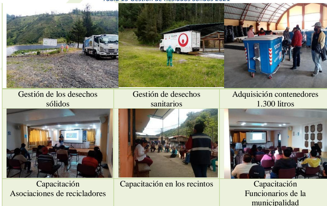
Gestión de los desechos sólidos