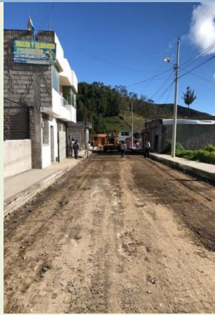
Calle Juan Sagastibelza