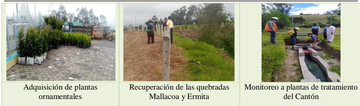
Adquisición de plantas ornamentales