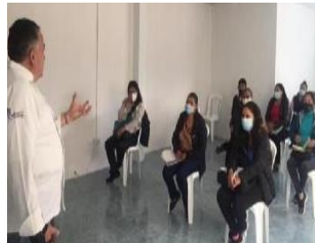
Taller “cocina segura” MINTUR

Para fomentar el turismo en el cantón se trabajó en varios sectores como vialidad, dotación de servicios básicos, señalética, áreas deportivas como se detalla en la sección de Obra Pública y Contratación Pública, además se realizaron eventos tradicionales y se apoyó a prestadores de servicios turísticos mediante autogestión en cuanto a capacitaciones sobre el manejo de la plataforma SITUNIR que pretende actualizar la información de cada establecimiento turístico, en innovación turística para captar turismo receptivo y se presentó también el Plan de Desarrollo Turístico Cantonal que es el primer instrumento en esta materia que permite realizar acciones planificadas en todo el cantón.