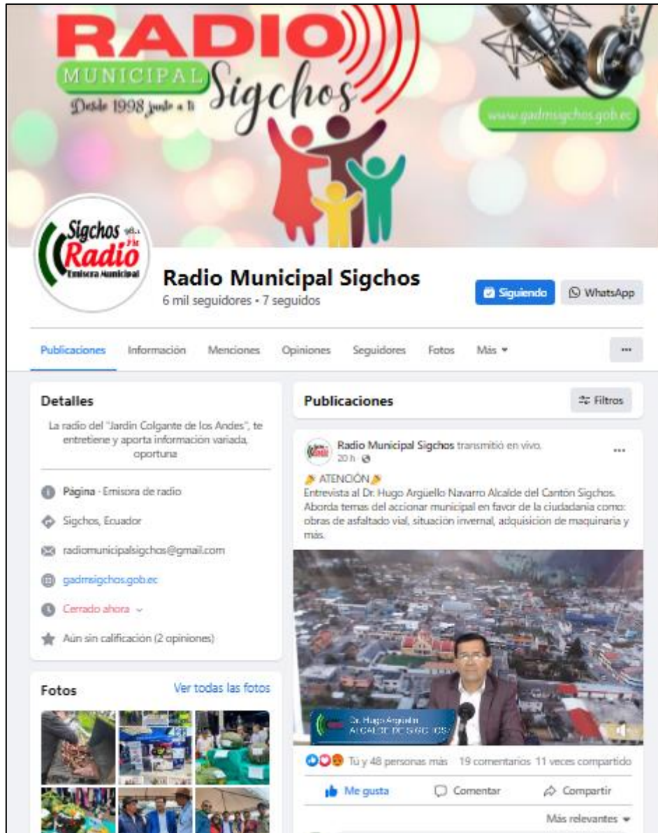
Imagen correspondiente a la Fanpage Facebook de Radio Municipal Sigchos https://www.facebook.com/RadioMunicipalSigchos

Se puede evidenciar que hay un incremento continuo de seguidores a la página de la red social permitiéndonos llegar a más personas y oyentes de nuestro medio de comunicación. La Fanpage de Facebook actualmente cuenta con un total de seis mil seguidores (6.000) quienes interactúan con comentarios, interacciones y visualizaciones de videos.