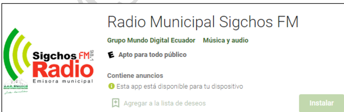
Imagen correspondiente a la aplicación de la Radio para dispositivos móviles en Google Play

La aplicación de Radio Municipal Sigchos, para dispositivos móviles, permite escuchar la programación en directo y en cualquier momento o en cualquier lugar. Este servicio es completamente gratuito y solo se necesita de internet para poder utilizarlo. Permitiendo mantener conectados con Sigchenses residentes en diferentes partes del mundo.