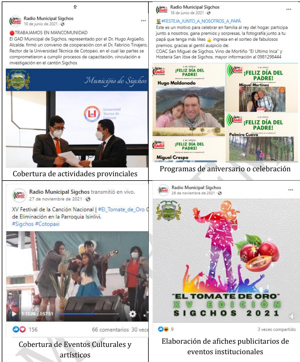
Cobertura de actividades provinciales