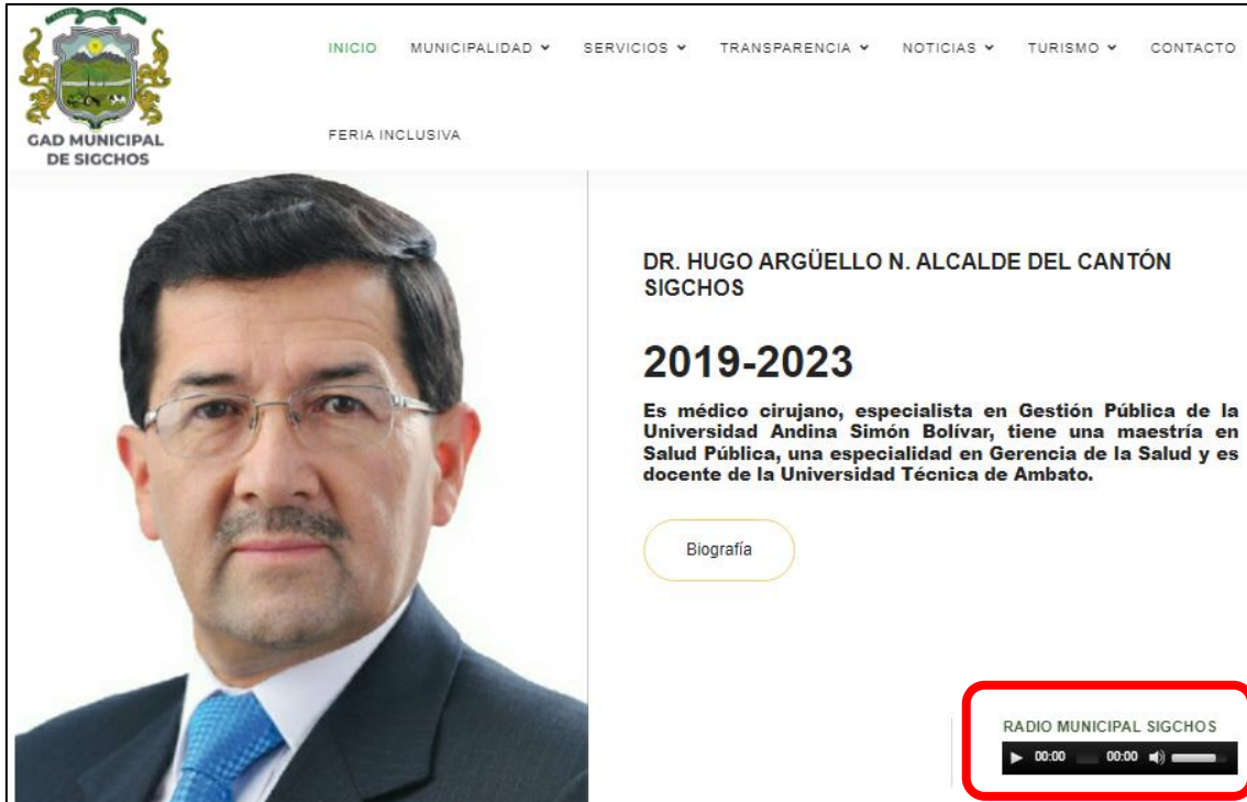
Imagen correspondiente a la Página Web y Streaming de la Radio https://www.gadmsigchos.gob.ec/new/